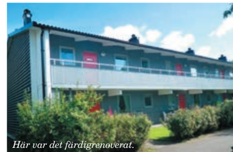
Här var det färdigrenoverat.