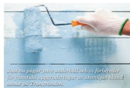
Just nu pågår yttre underhåll och vi förbereder för framtida uppgraderingar av utemiljön bland annat på Trangränden.

Under den närmaste tiden kommer vi att utföra utvändiga målningsarbeten på Ida sömmerskas gränd och Starvägen i Skanör. Vi kommer att gå ut med ytterligare information i god tid, till hyresgäster på dessa adresser.