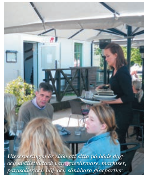
Uteserveringen är skön att sitta på både dag- och kvällstid tack vare gasvärmare, markiser, parasoller och höj- och sänkbara glaspartier.