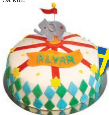
Konstverk från Mimmas Tårtdesign.