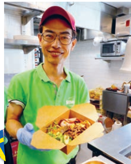
Risnudelsalladen har snabbt blivit populär. Nu finns den både som dagens och på kvällsmenyn.

Totalrenoveringen av lokalerna som tidigare inrymde Vellingegrillen har innefattat uppgradering av alla ytskikt – väggar har målats och kaklats, golven har fått klinkers, planlösningen har ändrats, nya rör- och elinstallationer har dragits och en fettavskiljare har installerats. Resultatet är ett modernt kök – och restaurang.