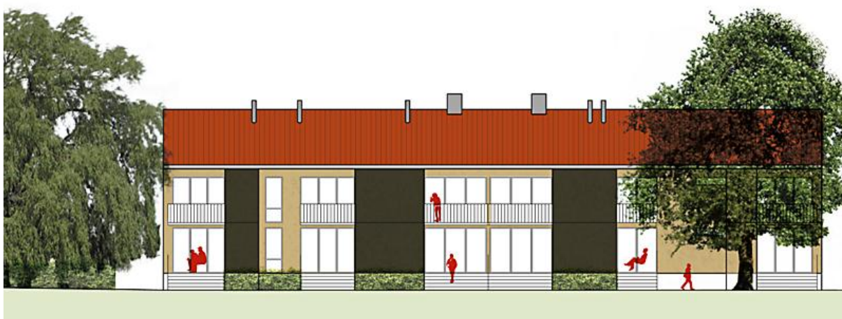
Fasad kvarteret Svalan

Kvarteret Svalan består av en huskropp med två våningar. De ljusa och vackra lägenheterna har antingen egen uteplats eller rymliga balkonger. Materialvalen är klassiska med golv av parkett samt kakel och klinker. Vi bygger fyra ettor, sex tvåor och två treor på cirka 35-76 m 2 .