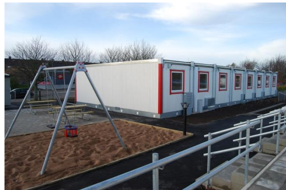
Bild från etableringsboendet väster om kommunhuset i Vellinge.

Under byggnationen är området belyst och bevakat av försäkringsskäl.